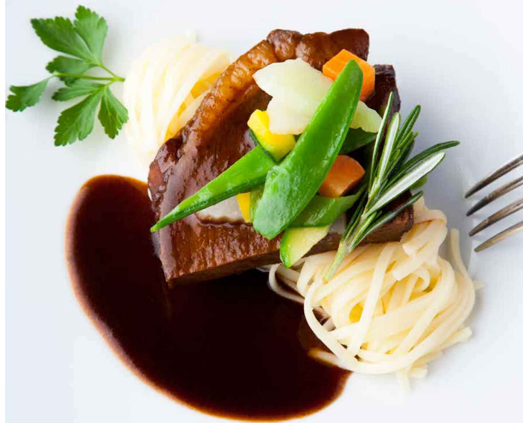
Auch in der gehobenen badischen Küche ist der Chef zuhause.