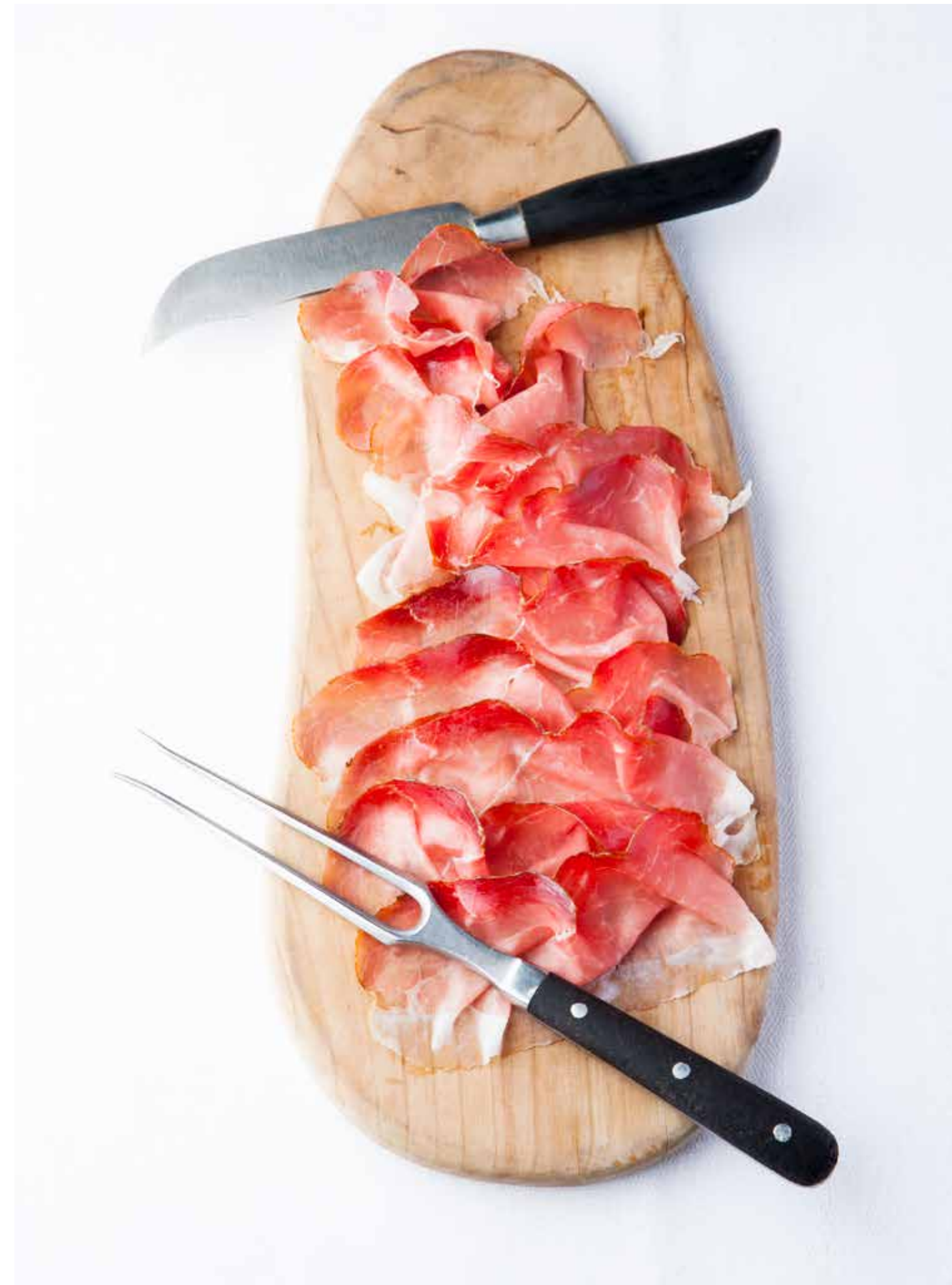
Hausgemachter roher Markgräfler Schinken